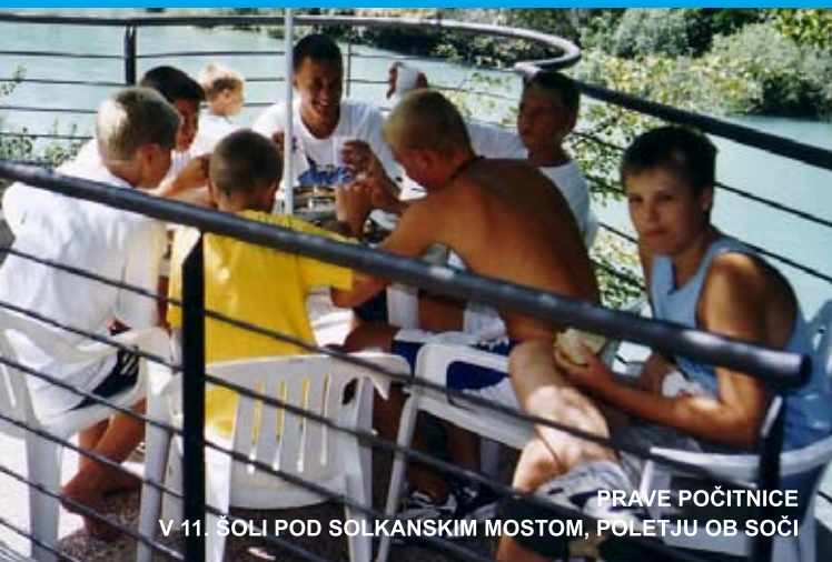
PRAVE POČITNICE V 11. ŠOLI POD SOLKANSKIM MOSTOM, POLETJU OB SOČI

Prave počitnice so takrat, ko greš k reki, v hribe ali na morje; kadar ni dolgčas, ko je prava družba, smeh Naj bodo takšne vaše letošnje poletne počitnice!