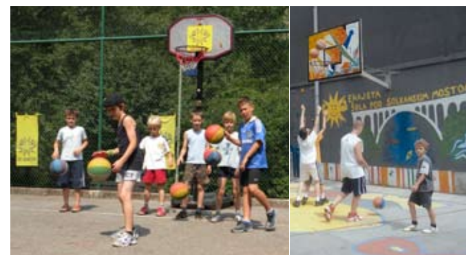
Tudi letos bodo gostje na treningih pri Soči odlični mladi košarkarji iz Črne Gore.