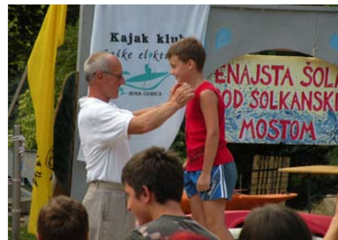
Najuspešnejši slovenski športnik Miro Cerar podeljuje spominska priznanja udeležencem 11. šole pod Solkanskim mostom.