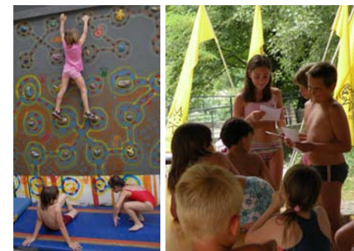
Kdor bo želel, bo lahko tudi plezal, recital ali se podal na izlet ...

Še več o ŠD SONČEK lahko najdete na spletni strani: http://www.sportnodrustvo-soncek.si