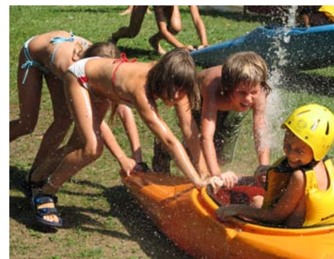
Igre brez meja Poletja ob Soči.