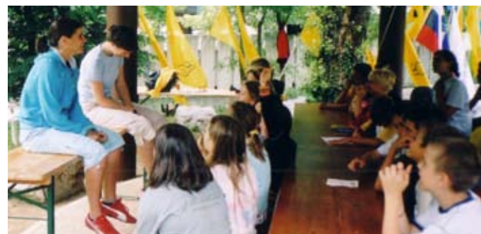
Obiskali nas bodo športniki, glasbeniki, biologi, ribiči...