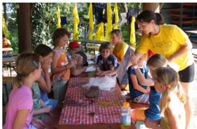
Ustvarjalne delavnice Poletja ob Soči.