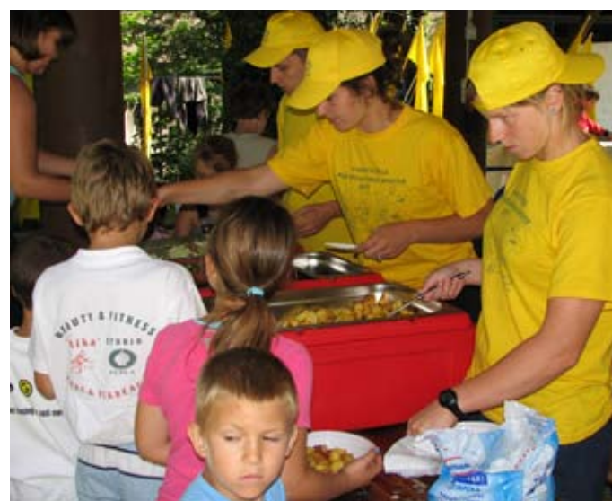
Pri Soči ne bomo lačni, niti žejni...