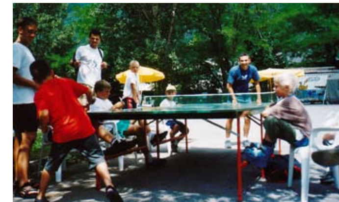
V Poletju ob Soči bodo tudi tekme, kot je bila tekma proti Bojanu Tokiču - najboljšemu slovenskemu igralcu namiznega tenisa.