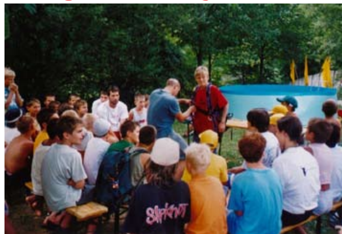
"Pouk" jadrnega padalstva v Enajsti šoli pod Solkanskim mostom

...namizni tenis, lokostrelstvo, začetni in nadaljevalni tečaj kajaka, rafting, pikado, športno plezanje, orientacija, "špljake", badminton, glasbene in likovne ter ustvarjalne delavnice, Soška liga v nogometu, košarki, odbojki, hokeju, ... V KLEPETU ob SOČI bomo kramljali z zanimivimi gosti.