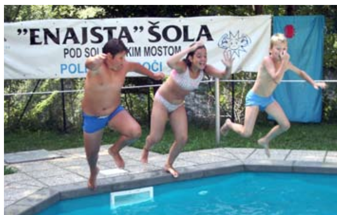
V naših dosedanjih programih pri Soči je sodelovalo že več kot 2000 otrok.