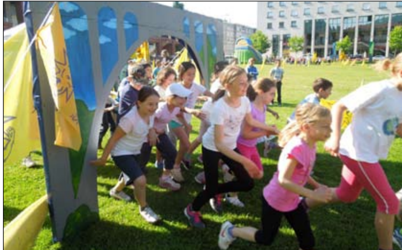
Tekmovanje tretješolcev v teku.