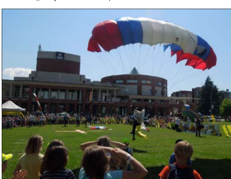
Pristanek padalcev na travnik med publiko.

Male olimpijske igre Nove Gorice so bile zasnovane zelo pozitivno in prijazno do otrok. Glavno vodilo celotnega dogajanja je bilo sodelovati na različnih športnih aktivnostih in ne zmagati. Bistvo pa je bilo ukvarjati se s športom. Tega je pri današnjih otrocih vse manj, to opažamo tudi učitelji